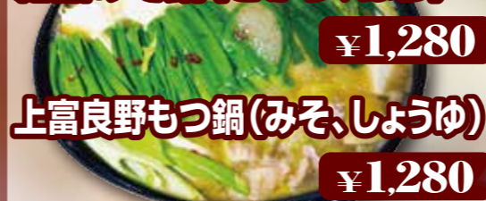
鍋の表示価格は1人前です、2人前からのご注文となります。